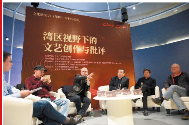
湾区视野下的文艺创作与批评——文化软实力(深圳)新桥平行分论坛现场