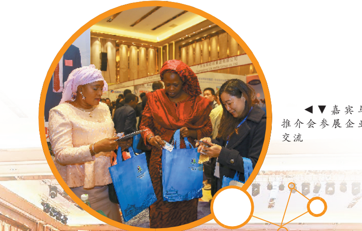
▲▼ 嘉宾与推介会参展企业交流

广东企业“走进非洲”,为新的产业全球化布局注入新活力。 在此次推介会上,第一个签约的项目是“二手车进入尼日利亚”,广东旧机动车交易有限公司、深圳中远海运物流有限公司、非洲粤商总会三方共同发挥各自优势,合力开辟非洲二手车及相关产品市场,实现优势互补,谋求共同发展。 国际产能合作是“一带一路”倡议下中非经贸合作的重要引擎,发展工业园区是尼日利亚经济结构转型以及工业化发展的重要抓手。在现场签约的还有位于尼日利亚奥贡省广东自贸区、由广东睿隆进出口有限公司建设运营的鞋业鞋城。鞋业是劳动密集型产业,能一定程度上解决当地就业问题,增加当地居民收入。项目将围绕塑料拖鞋制造打造一条生产产业链,首期用地200亩,总规划用地1000亩。 第三个现场签约的项目是