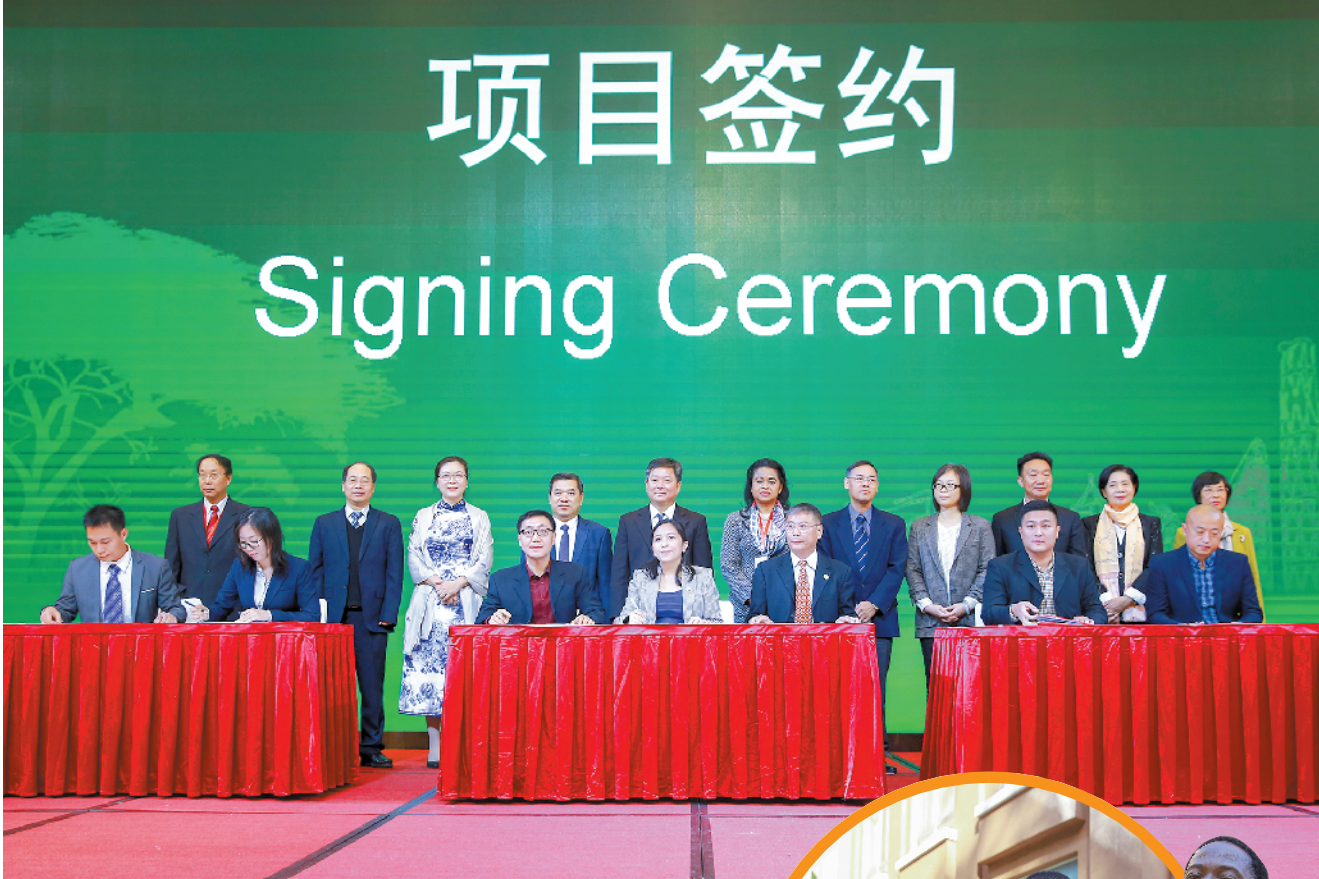
广东企业与非洲合作的三大项目签约现场