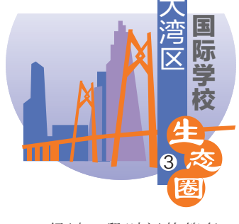
大湾区国际学校生态圈

孩子们能够在课堂上接触麻省理工学院、茱莉亚艺术学院的课程。我们的孩子不仅完成了国家九年义务教育课程，同时还有机会站在巨人的肩膀上。立鸿鹄之志，让他们从小升入初中就有机会接触到国际顶尖大学的教育，包括理念、探索方向的渗透。另一方面，通过集团办学，我们能提供非常好的教师职业培训平台。”