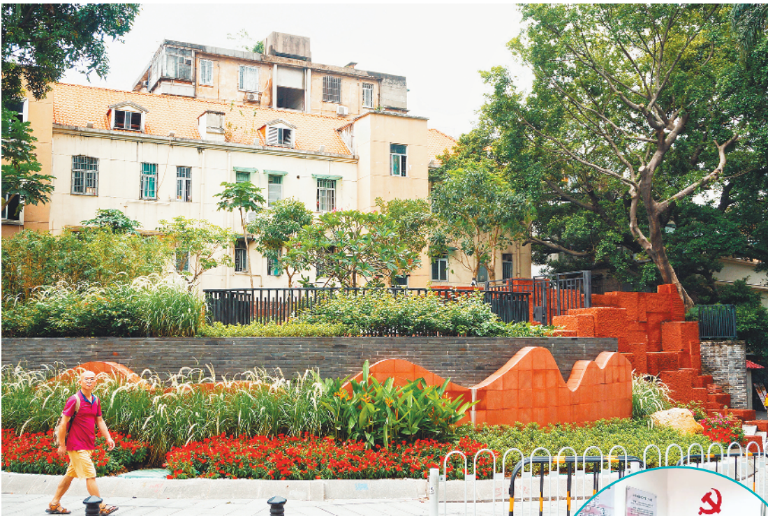
越秀城市建设和社会治理不断创新,极大增强了居民的幸福感

目前，这张“心”网已“网住”了省、市、区精神卫生专家约56人，构成越秀区社会心理服务专家库，负责咨询、指导、培训、宣讲，开展针对性的心理服务等。据统计，针对心理健康急救知识、心理健康问题识别以及对心理健康问题人员提供初步援助等的培训，已开展2期，培训人员100余人。3月份以来，依托心理服务工作站，以点带面，辐射全区，在各街道开展以“健康睡眠，益智护脑”为主题的科普活动，共培训社区心理健康服务工作站工作人员、社区精防医生及居民群众、青少年学生1200余人。