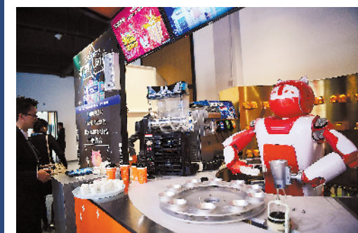
来一杯机器人调制的饮品