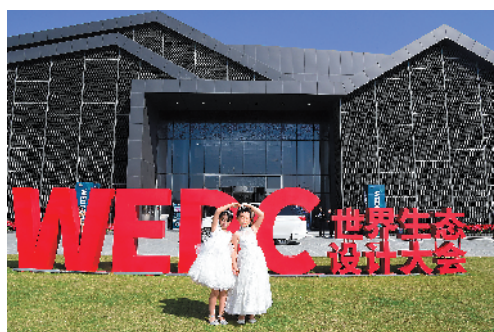
有设计感的大会现场吸引孩子们留影