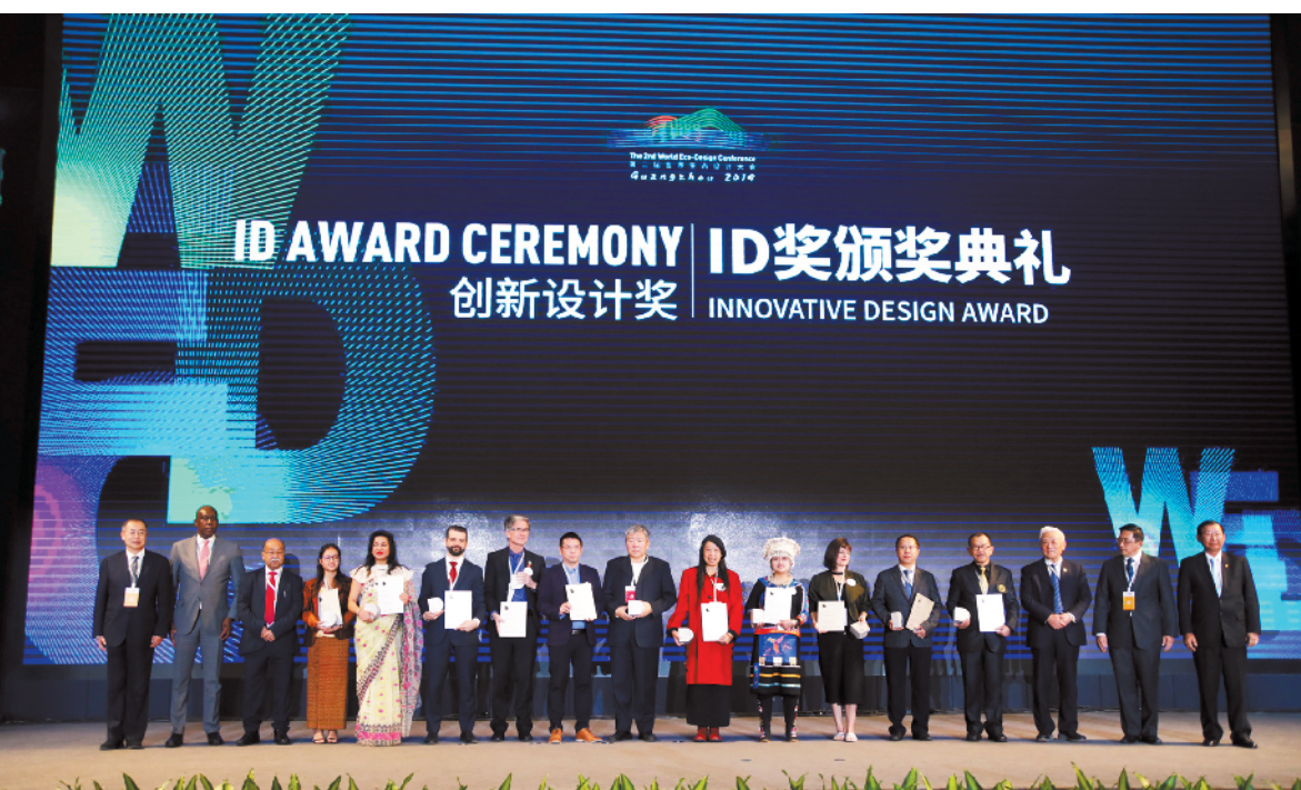
创新设计奖评选结果揭晓