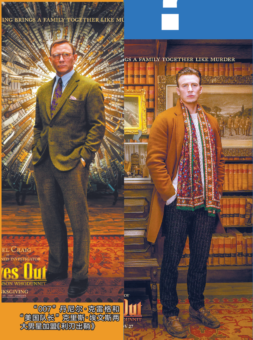
“007”丹尼尔·克雷格和“美国队长”克里斯·埃文斯两大男星加盟《利刃出鞘》