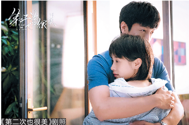
《第二次也很美》剧照

2017 年，电视剧《我的前半生》红遍全国，此后“师奶逆袭”“女性群像”等话题成为影视圈的关注重点。一年半过去，当时启动的创作风潮，如今已经“初见效果”。最近有两部剧都沿用了《我的前半生》的模式，一部是由王子文主演的《第二次也很美》，另一部是由杨千嬅主演的《多功能老婆》。