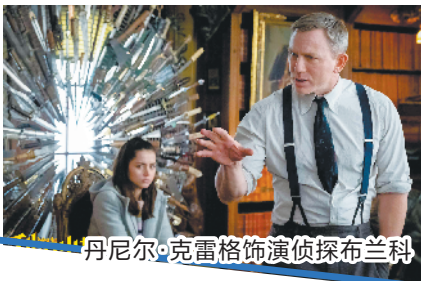
丹尼尔·克雷格饰演侦探布兰科