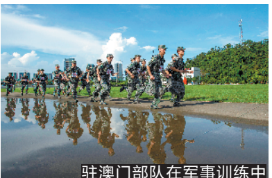
驻澳门部队在军事训练中