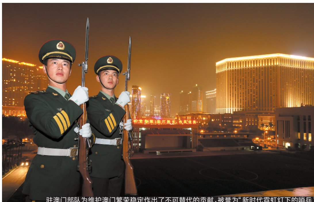
驻澳门部队为维护澳门繁荣稳定作出了不可替代的贡献,被誉为“新时代霓虹灯下的哨兵”

20年风雨铸忠诚,20载军旗耀濠江。20年来,驻澳门部队用实际行动出色书写了威武文明的时代答卷,为维护澳门繁荣稳定作出了不可替代的贡献,被誉为“新时代霓虹灯下的哨兵”。近日,羊城晚报记者走进驻澳门部队,透过驻澳门部队光辉历程中的变与不变,探寻这支威武文明的基因密码。