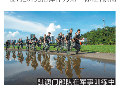
驻澳门部队在军事训练中

夜幕降临,灯光璀璨。五光十色绚烂了澳门这座不夜城,也映照出营门值勤哨兵年轻的脸庞。