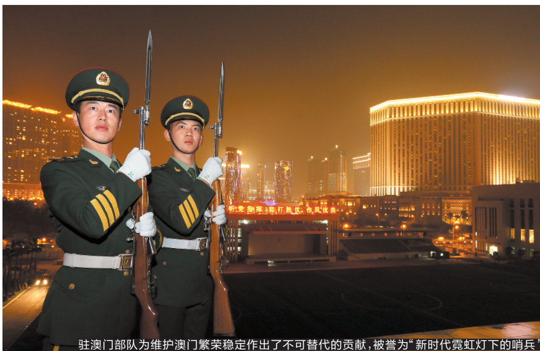
驻澳门部队为维护澳门繁荣稳定作出了不可替代的贡献,被誉为“新时代霓虹灯下的哨兵”

20年风雨铸忠诚,20载军旗耀濠江。20年来,驻澳门部队用实际行动出色书写了威武文明的时代答卷,为维护澳门繁荣稳定作出了不可替代的贡献,被誉为“新时代霓虹灯下的哨兵”。近日,羊城晚报记者走进驻澳门部队,透过驻澳门部队光辉历程中的变与不变,探寻这支部队威武文明的基因密码。