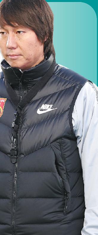
中国队主教练李铁