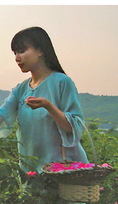
采花做美食

在采访中，李子柒回应了一些外界对她的好奇和质疑。李子柒表示，自己拍摄这一系列视频的初衷是让人们放下压力，轻松一下。“如今的社會中，人们压力很大。所以我希望他们在忙碌一天之后，打开我的视频能感到轻松和美好。”她减轻了一些焦虑和压力感。“她想让生活在大都市里的孩子们知