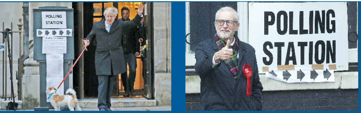
12日,约翰逊在伦敦一个投票站投票后离开