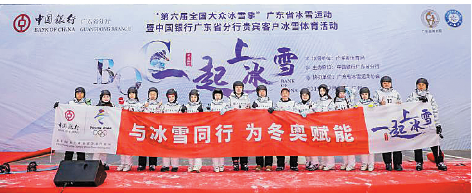
12月14日,中国银行广东省分行联合广东省体育局、广东省冰雪运动协会,在花都融创雪世界举办客户冰雪体育活动

近年来,广东省委、省政府支持北京冬奥会的筹办和备战,将发展冰雪项目纳入“广东省十五体育规划”,通过竞技冰雪运动、群众冰雪运动、冰雪体育产业、冰雪运动宣传等系列措施的落实,推动冰雪产业在粤发展,进一步提升冰雪产业效益。 据市场调研机构易观联合腾讯体育及TOYOTA发布的《2018中国冰雪产业白皮书》显示:2018年广东省滑雪人次年增速为166.67%,位居全国榜首。2018年广东省的滑雪企业数量共400家,排在吉林、辽宁、北京等地之前。2022年北京冬奥会吉祥物“冰墩墩”的设计者来自广州美术学院的师生……广东与冰雪的深厚“情缘”可见一斑。 2017年7月13日,中国银行成为北京2022年冬奥会和冬残奥会官方银行合作伙伴。近年来,中国银行广东省分行切实发挥金融服务实体经济的职责,为广东冰雪产业相关企业提供流动资金贷款、现金管理等产品,协助企业与互联网、大数据、人工智能的融合,助力现代制造业国际化的发展,大力支持冰雪产业发展。(文/戴曼曼)