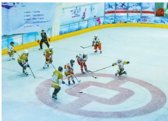
12月15日,主办方在广州正佳广场“冰河湾”室内溜冰场举办中国银行广东省分行冰雪嘉年华暨广东省冰球邀请赛