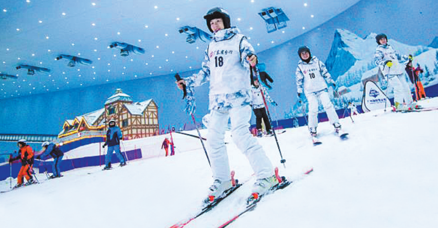
体验者们经过速成训练后开启“雪上之旅”

12月14日上午,在室内温度-5℃的广州融创雪世界里,几位身着红色教练服的“滑雪能手”矫健而娴熟地为体验者们演示着正确滑雪姿势和要领。 据悉,体验者们受中国银行广东省分行邀请参加“中银私享荟——一起上冰雪”活动,尽管被滑雪服裹得严严实实但兴致勃勃、热情不减。