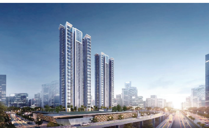
聚集了购物中心、音乐厅、美术馆以及十多个高端酒店,形成如梦似幻的产业集群。

未来这里有望崛起 12 万平方米的会展中心,并以横滨会展的发展模式为蓝本,打造特色产业。横滨会展中心是日本最著名的展览地之一,亦是依托轨道打造而成,步行 5 分钟即可到达地铁站,周边