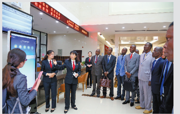
非洲知识产权组织成员国代表在广州知识产权法院参观