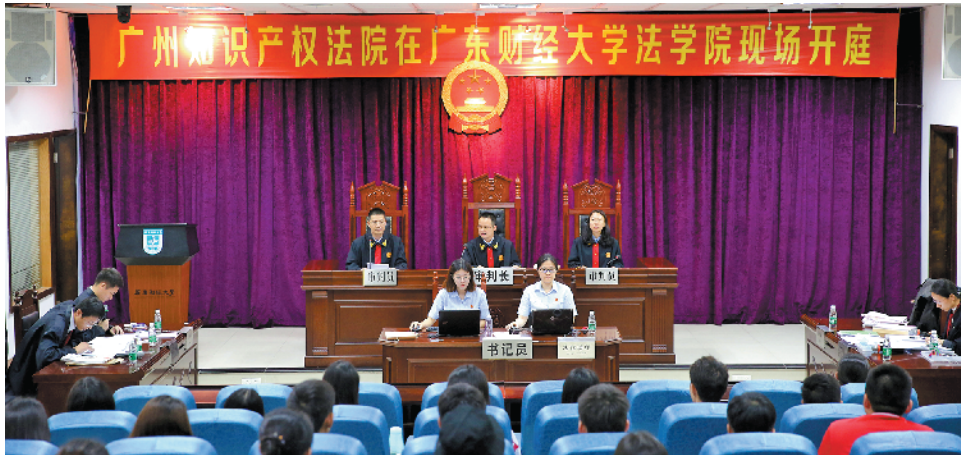
广州知识产权法院校园庭审现场

五年,1800 多个日夜,3 万多宗案件,浓缩成广州知识产权法院的成长简史。 今天是全国三家知识产权法院之一——广州知识产权法院成立五周年纪念日。 五年来,从“出生”时的一张白纸到今天审判、改革、服务的色彩斑斓,从立足岭南助力创新驱动发展,到平等保护获得一批国际知名外企赞誉逐渐成为世界知识产权纠纷解决的“优选地”,广州知识产权法院以裁判文书公正,用公正向时代交出答卷。