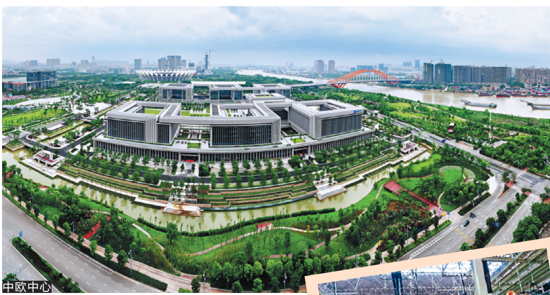
中德中心 充当区域、国际合作的桥头堡