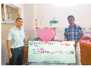
计生家庭保险，感恩中国人寿带给他的惠民保险，小小付出获得高额经济补偿，减轻了家庭经济压力。