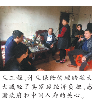
生工程，计生保险的理赔款大大减轻了其家庭经济负担，感谢政府和中国人寿的关心。