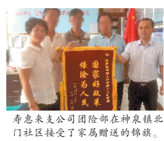
寿惠来支公司团险部在神泉镇北门社区接受了家属赠送的锦旗。