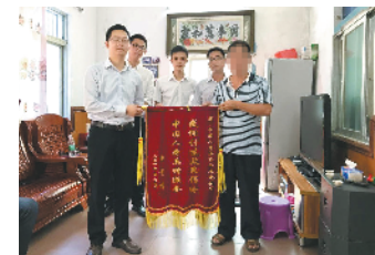
人都非常感激政府及中国人寿，使自己一家能够享受到政策性保险的保障。