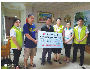
务专员一行到林先生家慰问，为中山市生育关怀行动添砖加瓦。