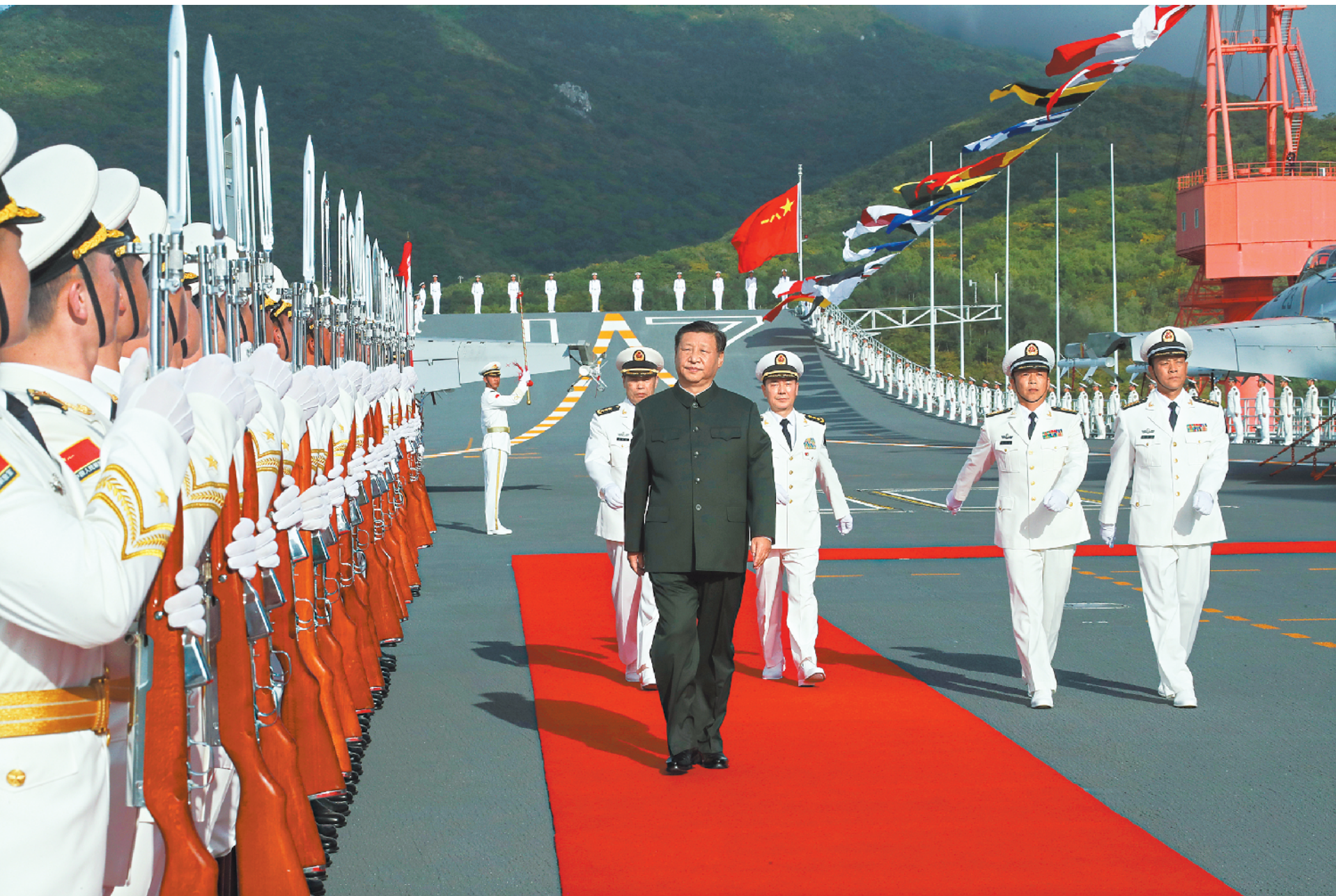
17日，我国第一艘国产航空母舰山东舰在海南三亚某军港交付海军，习近平出席交接入列仪式并登舰视察。仪式结束后，习近平登上山东舰，检阅仪仗队

中央和国家机关有关部门、军委机关有关部门、南部战区、海军、海南省以及航母建设单位的负责同志参加仪式。