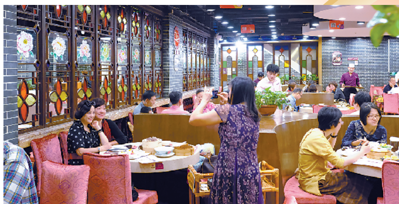
朱光词中的“茶室”今安在?只有“名点”依然受热播