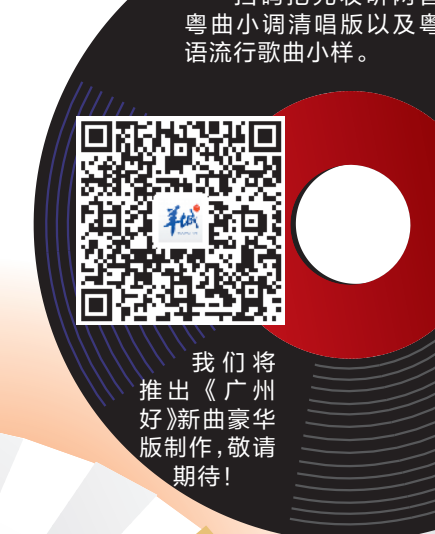
抢鲜听 扫码抢先收听两首粤曲小调清唱版以及粤语流行歌曲小样。我们将推出《广州好》新曲豪华版制作,敬请期待!