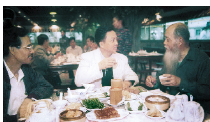
上世纪80年代广州街坊早茶