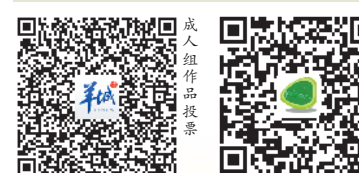
成人组作品投票 学生组作品投票