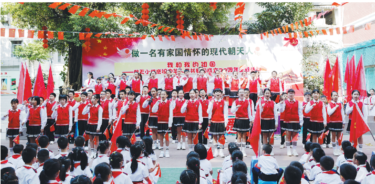
朝天小学六年级学生在“我和我的祖国”文艺汇演中表演《少年强则国强》

最近,中山大学孙逸仙纪念医院院长、乳腺癌专家宋尔卫增选为2019年中国科学院院士(下称“中科院院士”),他是个接地气的广州仔,也是朝小校友,回忆在朝小的学习,他很感激老师从没因成绩差而放弃任何一位学生。“我小学时并非尖子生,但老师选我参加广州市小学生智力竞赛,没想到拿了全市第一名。”宋尔卫的经历并非特例,而是朝小一以贯之“全人教育”理念的结果使然。在人才培养方式上,不管是广州同文馆时期还是后来的朝小时期,155年来传承下来的尊重个性、肯定价值和自信发展的“全人教育”理念一直与时俱进,不断丰富内涵。