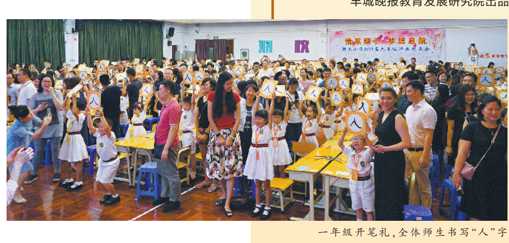
一年级开学礼,全体师生书写“人”字

也许正是在这三棵古榕的庇荫下,朝小在绿色GDP的教育之路上将‘同文文化’传承、创新和发展。”从最初执掌朝小到八年后的今天,孔虹总结:“我读朝天史—我读朝天史—我读朝天史”这条道路是走对了,我们仍然要不忘初心,继续发挥这所百年名校的育人功能与辐射影响力,培养学生的健全人格。全人教育,有起点,没有终点;同样,从同文走向未来,没有终点。”