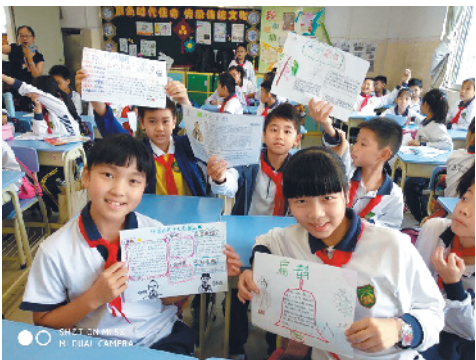
中医名家汇的组员(六年级)在进行研学汇报

广州同文馆“敢为人先”的优良传统影响了朝小在广州每一段历史时期的教育地位,作为广州教育改革的试点和先行者,朝小起到了领航教研、带头教改的作用,并辐射至广州市内外乃至全国的其他学校。