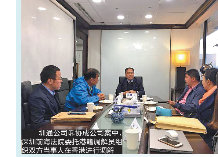
圳通公司诉协成公司案中，深圳前海法院委托港籍调解员组织双方当事人进行调解