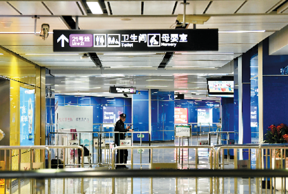
开通前夕，员村站内灯火通明

羊城晚报讯 记者程行报道：2020年“情暖驿站 满爱回家——中国石化关爱春节返乡务工人员公益活动”19日起至2020年1月9日全面接受社会报名，并在1月10日启动。今年将为返乡摩骑送出11000份免费加油礼包，开通14条“爱心大巴线路”和2条困难大学生“爱心送站”专线，广东、广西、江西、贵州、湖南五省（区）联动247座加油站提供10余项免费服务。