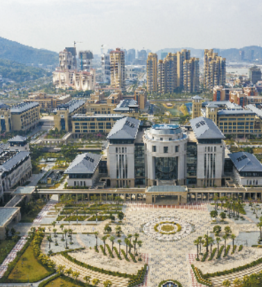
澳门大学