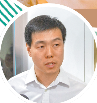
牛一鸣 羊城晚报记者 宋金峪 摄