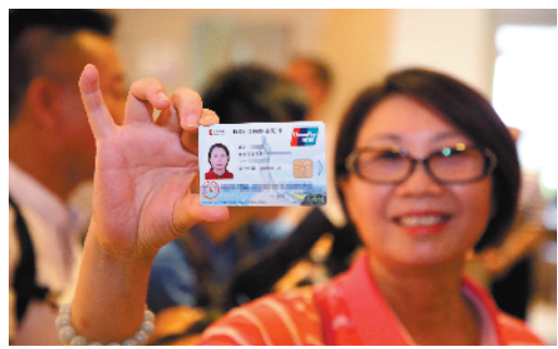
今年7月，首批澳门居民领到珠海医保社会保障卡(资料图)

“我相信未来5-10年，世界一流的养老院必定出现在中国。”罗盛宗说。 羊城晚报记者 王丹阳