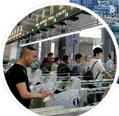
旅客从港珠澳大桥澳门边检大楼通关前往珠海