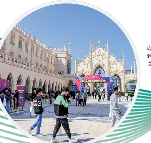
如今，在珠海横琴也可看到葡式建筑