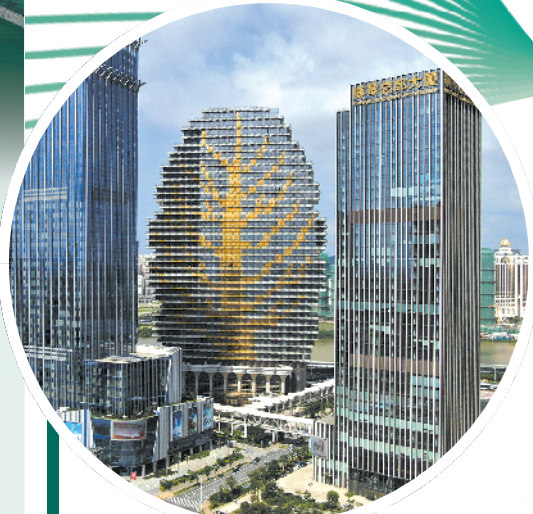
▲横琴自贸区高楼林立