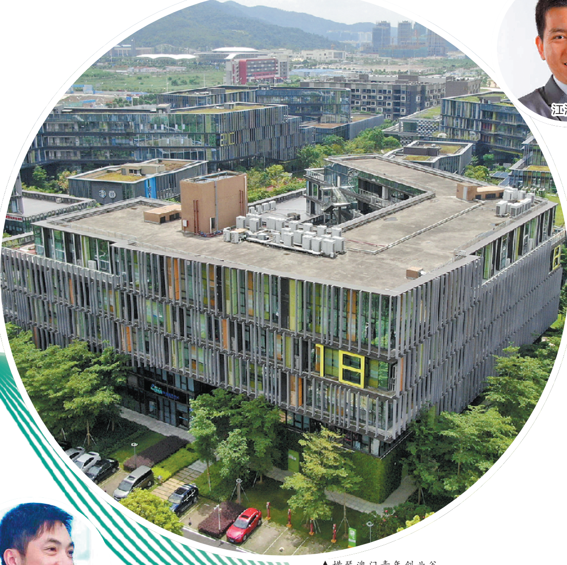
▲横琴澳门青年创业谷