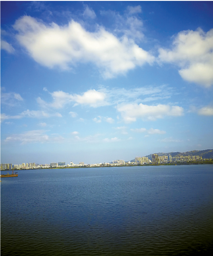
曾经被重度污染的练江越来越接近它原本该有的样子

溯流而上,在练江的源头普宁,站在占陇镇下寨村的练江堤上,记者看到的是一幅波光粼粼的景象,不远处还有人在江里垂钓。而在治理前,这里水面上长满