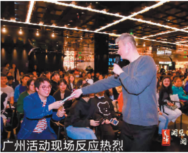
广州活动现场反应热烈

关正文:到处都谈IP,其实是件特别浮躁的事情。从知识产权的角度来讲,每一个节目都是IP,但其实没有几档节目具有大范围衍伸、开发的价值。即使是《哈利·波特》系列,到第六部电