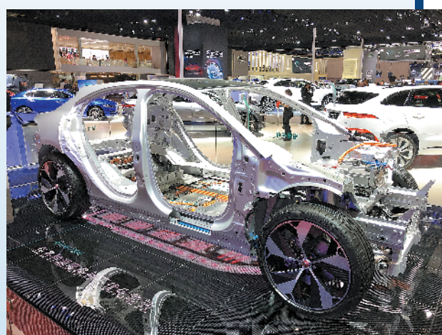
新能源车未来前景看好

这些获奖企业及车型,在 2019 年以实力说话,充分获得市场及消费者认可,以“破冰者”的勇气与姿态,引领车市不断前行。