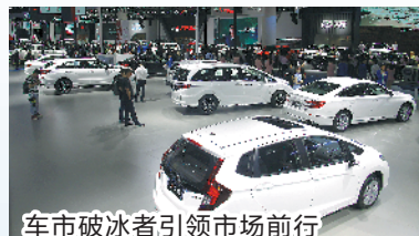
车市破冰者引领市场前行

2019年车市即将落下帷幕,这一年,车市毫无意外地持续承受下行压力。就连曾经大步前进的新能源车也被狠狠撞了一下腰。车市面临竞争白热化、车型同质化较明显、新车购买需求减弱、新能源车补贴退坡、车企盈利空间退减等一系列挑战。