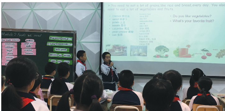
英语课堂上，同学们展示健康饮食研究

读视作最容易实现的素质教育，把推动阅读作为实现立德树人最有效的途径。“每个学生围绕自己最感兴趣的地方，通过小组合作，展开实地调研，收集资料，同时体验书中描写的东西，回来以后跟同学们汇报交流。我们把这称为海量—深阅读”，陈武谈到，龙口西小学正把海量—深阅读打造成特色教育活动，作为提升学生阅读素养的必由之路，加深孩子们的体验和思考。