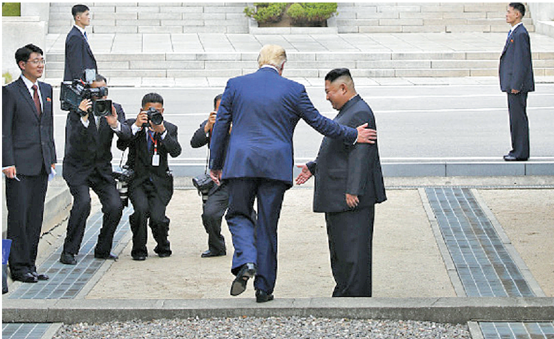
今年6月30日,特朗普在板门店与金正恩握手会面后,跨越军事分界线来到朝方一侧

2020年11月举行。在针对总统特朗普的弹劾案催化下,美国政治极化加剧,民主、共和两党矛盾激化,预计明年选战将持续高温。