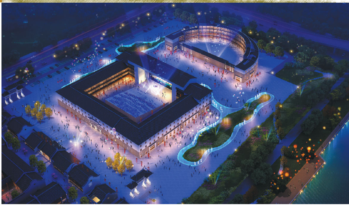
《原乡》演艺中心效果图