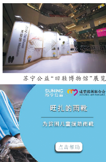
苏宁公益“旧鞋博物馆”展览

这是今年入围柏林国际电影节新生代竞赛单元电影《旺扎的雨靴》里的故事,也是发生在现实中的真实故事。从今年10月开始,天气逐渐转冷,有很多孩子像电影里的旺扎一样,没有一双像样的鞋子。对于他们来说,能实现心中梦想,保护自己内心的小小自尊的方法非常简单,就是在雨雪天里,能拥有一双能抵御寒冷的雨靴,自由奔跑。为此,成美慈善基金会、苏宁公益基金会、苏宁易购PLAZA、中国发展网能量中国平台、《旺扎的雨靴》电影摄制组一起行动,发出了为藏区孩子们送上一双双雨靴,让他们的童年也充满雨雪中奔跑快乐的倡议。目前,该活动已吸引到超过6万名实实在在的网民捐赠,筹善款超12万元,该项目的捐款和流程全部公开透明,为贫困孩子们献出一个力所能及的爱心。