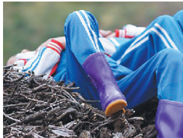
苏宁发起“旺扎的雨靴”公益项目

这是今年入围柏林国际电影节新生代竞赛单元电影《旺扎的雨靴》里的故事,也是发生在现实中的真实故事。从今年10月开始,天气逐渐转冷,有很多孩子像电影里的旺扎一样,没有一双像样的鞋子。对于他们来说,能实现心中梦想,保护自己内心的小小自尊的方法非常简单,就是在雨雪天里,能拥有一双能抵御寒冷的雨靴,自由奔跑。为此,成美慈善基金会、苏宁公益基金会、苏宁易购PLAZA、中国发展网能量中国平台、《旺扎的雨靴》电影摄制组一起行动,发出了为藏区孩子们送上一双双雨靴,让他们的童年也充满雨雪中奔跑快乐的倡议。目前,该活动已吸引到超过6万名实实在在的网民捐赠,筹善款超12万元,该项目的捐款和流程全部公开透明,为贫困孩子们献出一个力所能及的爱心。