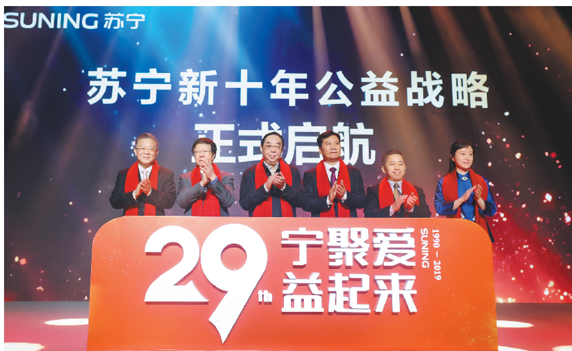
苏宁新十年公益战略正式启动