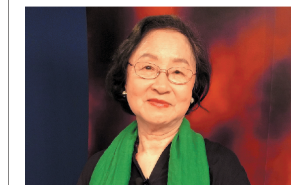
著名话剧演员、配音演员姚锡娟

“人们应该有一种危机感，碎片化的快生活让文化一点点被削弱。每个人都要反思，在文化修养上我们到底有多少底气。”年近80岁的姚锡娟说，希望人们能够降下浮躁的心，真正地沉潜学习，品读经典。