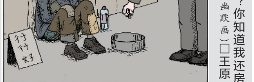
贷的压力多大呢?你知道我还房贷的压力多大吗? (幽默画)(王原)

店主站在柜台后紧咬双唇,难掩内心的感动。他沉默了一会儿后,微笑着说:“我祈祷所有的小猫都有一个像你这样善良的主人。”