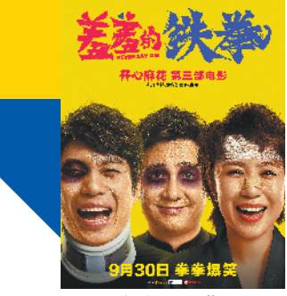
《羞羞的铁拳》也主打“爆笑”元素