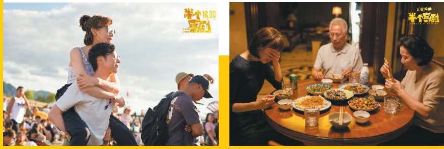
《半个喜剧》在恋爱喜剧的包装下反映社会现实和人生选择