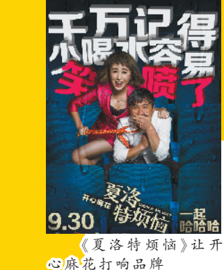
《夏洛特烦恼》让开心麻花打响品牌