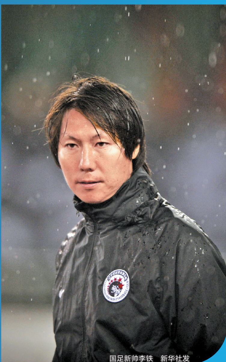
国足新帅李铁

少赛一场的国足40强赛还有4场比赛,目前落后小组头名叙利亚队8分。国足40强赛下一轮比赛(主场迎战马尔代夫队)将于今年3月26日举行。按照规则,40强赛8个小组的小组头名以及4个成绩最好的第二名将进入下一阶段的十二强赛。如要出线,国足恐需赢下剩余4场40强赛。