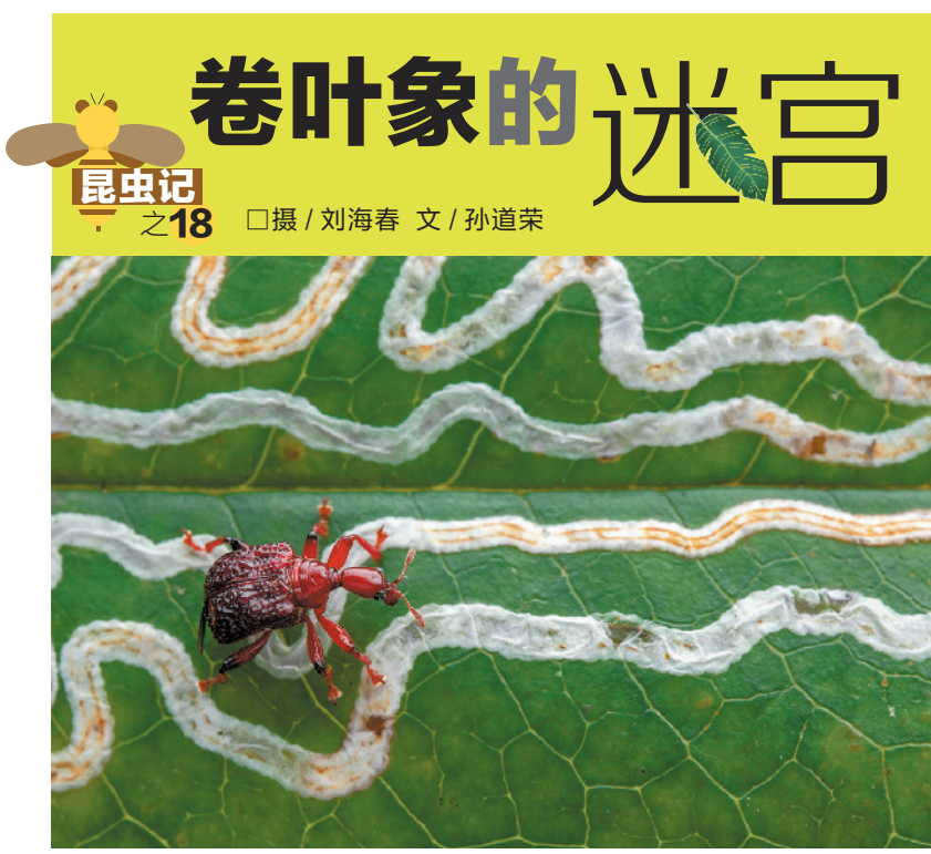
昆虫记 卷叶象的迷宫

每年春晚，挂在节目主持人嘴边儿的一个词就是“国泰民安”，然而不见得几个人知道这个成语的确切意思，可是弄懂它的确切意思很有现实意义。先看商务印书馆的《应用汉语词典》解释： 国泰民安——国家太平，人民安乐。形容社会安定的太平时代。 即使这样的权威词典的解释也是有问题的。虽然“泰”与“太”谐音，然而“泰”在古汉语里并不作“太平”讲。“泰”在古汉语里最基本、最重要的意义是足够、富裕、量大等。例如： 亡而为有，虚而为盈，约而为泰，难乎有恒矣。（《论语·述而》）按，“约”，贫简；“泰”，富裕。 凡虑事欲熟，而用财欲泰。（《荀子·议兵》）按，“用财欲泰”，希望有足够多的财物可用。 彭更问曰：“后车数十乘，从者数百人，以传食于诸侯，不以泰乎？”（《孟子·滕文公下》） 上述的“泰”都是指财富充裕。“国泰民安”这一成语出自宋·吴自牧《梦粱录·山川神》，原文为： 每岁海潮大溢，冲激州城，春秋醮祭，诏命学士院，撰青词以祈国泰民安。 从上下文看，上例的“泰”不是作“太平”讲，而是指“财富充裕”。前面讲每年很多地方遭受海潮之灾，灾民缺衣少食，背井离乡，他们亟须国家赈灾救济。那么，如果国家贫穷，也就没有力量救百姓于水火。所以，文人学士祈祷“国家富有，财富充裕”，如此才能救济灾民，实现“民安”。这里跟“和平”或者“战乱”没有关系，因而“泰”不作“太平”讲。 我们也不难理解“国泰”和“民安”之间是因果关系：只有国家富足了，才能保证百姓安宁，才能得到国家的救助。然而，流行的解释，则只是对现状的平面描写，忽略了这层关于国家财力与人民安宁之间关系的深意。