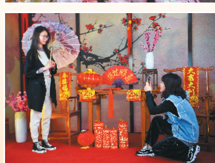
游船河、逛花街、睇花灯……广州永庆坊启动“最具岭南特色”的新春系列活动