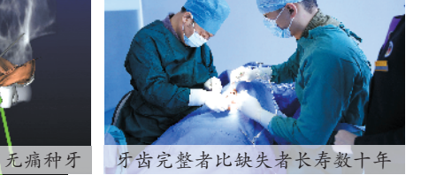
舒眠种植的使用实现了无痛种牙