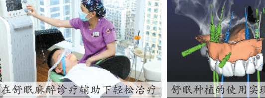
在舒眠麻醉种牙帮助下轻松治疗

导、行为引导、分散注意力、吸入镇静、STA无痛注射局部给药、中深度镇静以及全身麻醉等方法来辅助完成手术，种牙手术过程中实时监测患者呼吸、脉搏、血氧等情况，麻醉专家专业陪护。简而言之，舒眠麻醉诊疗在种牙方面的贡献在于：为市民舒缓术前紧张，术中享受舒适、无痛种牙，保障安全的同时追求舒适和人性化。除了舒眠麻醉诊疗，无痛种牙得以实现的另一个不可缺少的技术是数字化种植技术，即科学获取缺牙者口内情况和数据后，专家通过电脑反复设计和模拟其植体受力的均衡和植体植入的角度、深度等问题，输出数字化导板辅助种植，无需翻开牙龈定点植入，伤口只有米粒大小，术后当天就能正常进食；正是严格把控了手术的微创度，很多种过牙的市民表示：哪怕麻醉消散后，疼痛感也不强烈，个别身体较好的市民甚至无需服用止痛药，真正的微创无痛！