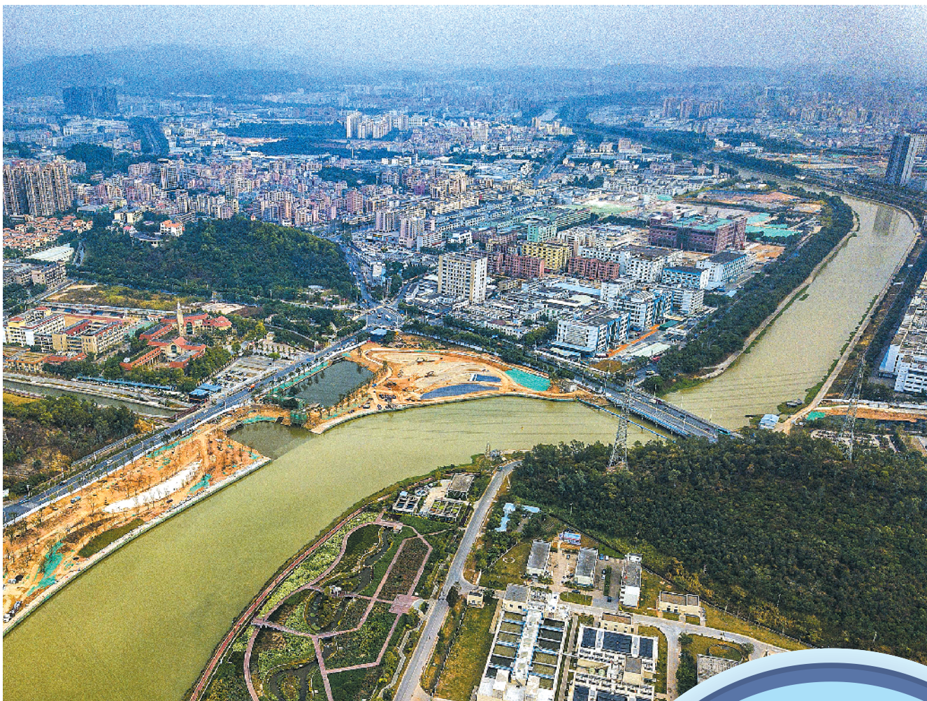
深圳五大河流之一的茅洲河告别黑臭

深圳河是深圳和香港的界河,而今全年水质均值达地表水Ⅴ类标准,为1982年以来最好水平。曾经,包括深圳河在内的深圳五大河流水质都是劣Ⅴ类,全市310条河流中逾半是黑臭水体。到了去年年底,深圳水环境实现历史性转折,所有黑臭水体均已不黑不臭。深圳在全国率先实现了全市域消除黑臭水体,奋力在生态文明建设上“先行示范”,打造人与自然和谐共生的美丽中国典范。