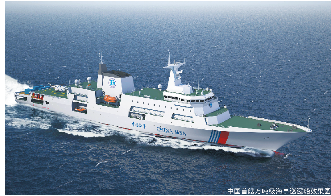
中国首艘万吨级海事巡逻船效果图

羊城晚报讯 记者沈钊报道:7日,记者从广东海事局了解到,中国首艘万吨级海事巡逻船已开工建造。该船建成后,将一跃成为国内吨位最大、装备最优良的海事巡逻船。