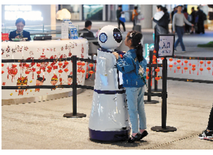
1月9日，旅客在港珠澳大桥珠海口岸旅客中心可享受机器人智能问询服务