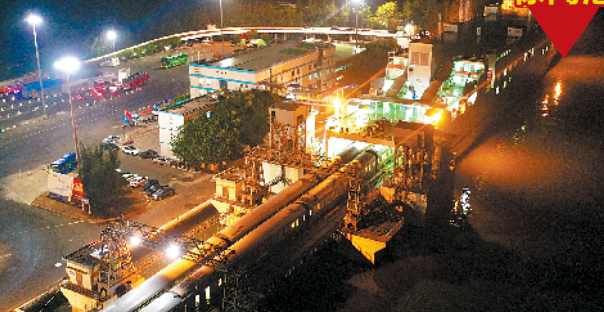
10日早晨6时半，停靠在湛江徐闻北港码头的“粤海铁3号”渡轮迎来Z111次列车