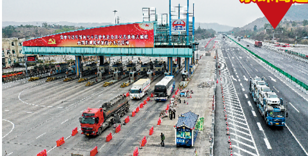
春运启动，京珠北高速粤湘交界处车流顺畅

10日早晨6时半，停靠在湛江徐闻北港码头的“粤海铁3号”渡轮迎来Z111次列车