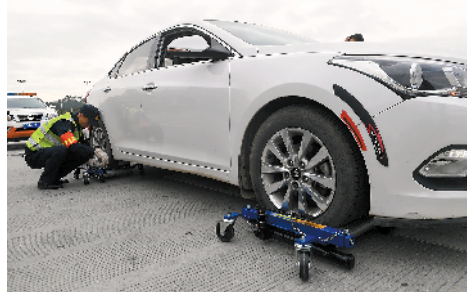
使用“移车神器”，不到3分钟便可将车辆挪开

记者9日从广州交投集团获悉，该集团管养的13条高速公路大多处于珠三角核心或春运主要客流干道，预计2020年春运期间日均车流量约125.3万车次。此外，今年将在春运中首次投入使用“便携式移车器”，并利用无人机加装喇叭远程喊话，进行交通指挥，打造“智慧春运”。