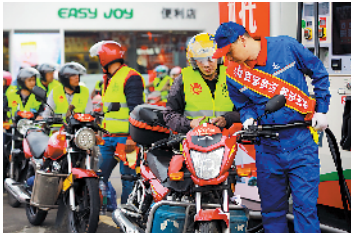
“返乡摩托”排队加油

做一件好事很容易，而坚持连做8年、使受益人群越来越多并不容易。今年已是中石化携手广东共青团“情暖驿站·关爱回家”大型公益活动开展的第8年。今天正值春运首日，早上9时，中国石化“情暖驿站·关爱回家”大型爱心公益活动在广东佛山龙山加油站、广东中山东风加油站、广西梧州都连加油站同时启动。记者在佛山龙山加油站现场看到，数百辆“返乡摩托”在工作人员的指引下有序排队，等待免费加油，踏上回家的路。