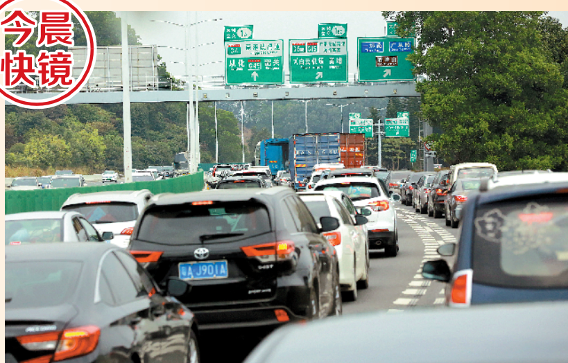
1月18日，高速公路开始出现春运出行高峰。广州华南快速石门堂山隧道附近路段北行方向出现一定程度拥堵

因素叠加影响，1月17日白天京珠北和乐广高速出现拥堵缓行路段超过30公里，其中京珠北拥堵至坪石收费站，乐广高速拥堵至乐昌收费站。