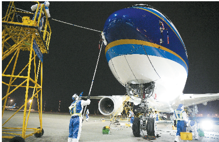
清洗人员洗刷A350客飞机头

飞机清洁已引进最新的干洗技术,相比之前的水洗,可节水超过99%。“既省水又省时。”