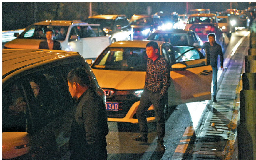
昨日,京港澳高速,距原粤北收费站28公里处,车龙延绵

交警部门建议,北行车主可提前从武深高速丹霞山出口驶离高速,经国道G106线绕行行驶至湖南并坡收费站再重新返回高速行驶。