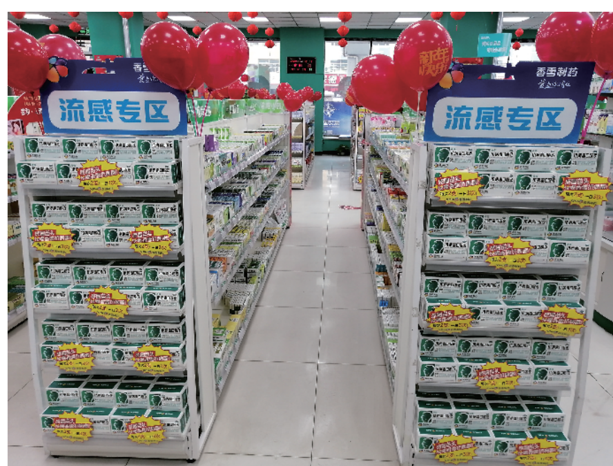
流感专区陈列药物

中医药对流感的认识和防治古已有之,大批基于古方或现代药理学研究的防治流感的中成药投入市场,《中华人民共和国药典》(2010年)中有记载防治感冒的中成药品种就有上百种。中医辩证学认为,流感、禽流感、SARS等