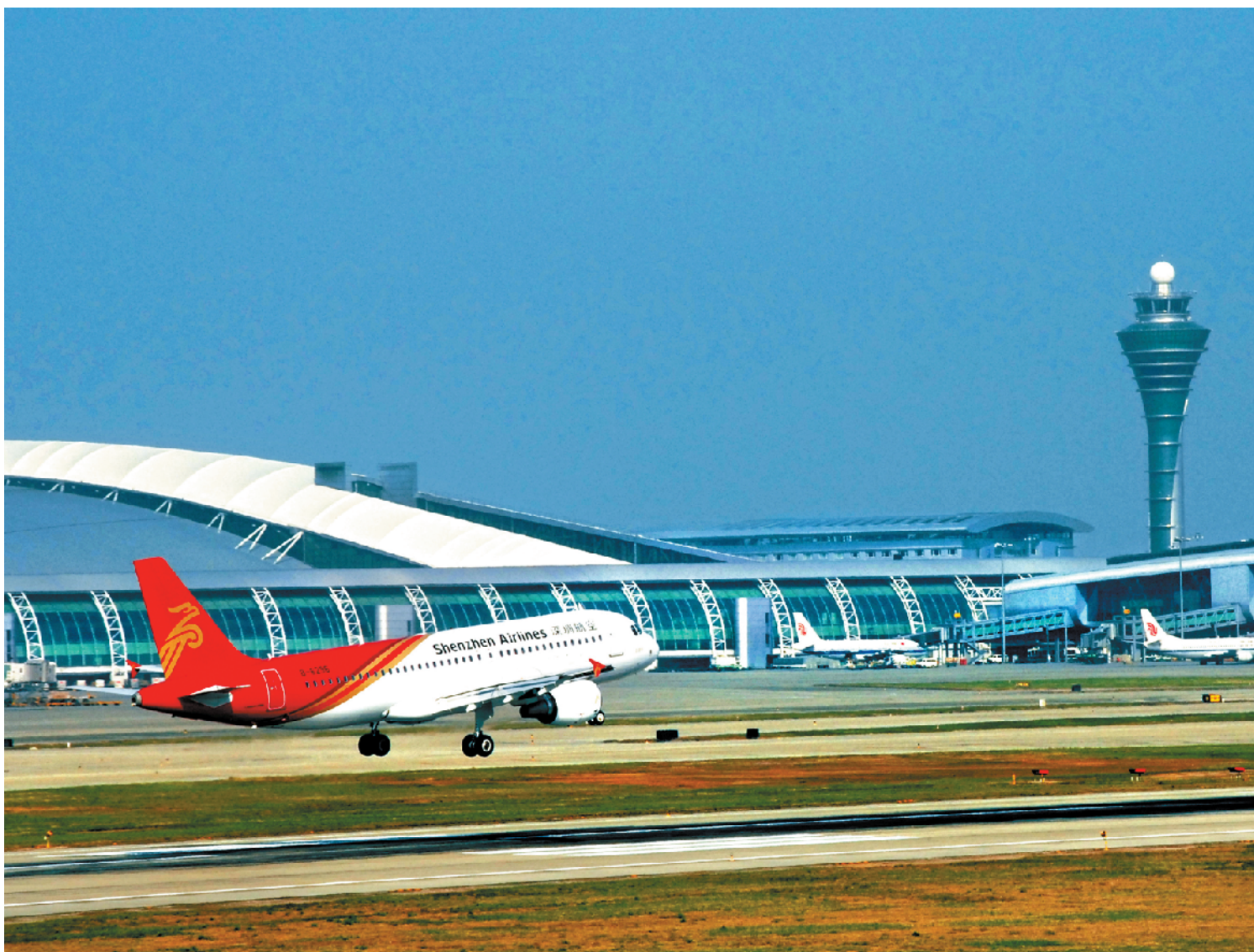
▲坐落在花都区的广州白云国际机场去年客流量突破7000万人次，开启了世界一流航空枢纽建设新篇章

急企业之所急，把审批效率视为重中之重，为重点项目报建审批提供“保姆式”服务，让企业方面很满意。“我们这个项目还挺顺利的，从立项到完成施工报建，前后就40个工作日。”阳光城集团花都湖北项目相关负责人介绍，花都区重点项目建设服务中心安排专人对接，对每个阶段遇到的问题都给予很大帮助，项目很快开工。“这比我们在其他地方一些项目，要快很多。”该负责人说。阳光城集团项目的速度并非单例。位于花都区炭步镇的广州迪柯尼服饰生产建设项目，也正是在花都区重点项目建设服务中心“全程代办”的情况下，得以很快开工。项目相关负责人介绍，报建过程中会有个微信群，大家有问题能在群里及时沟通。