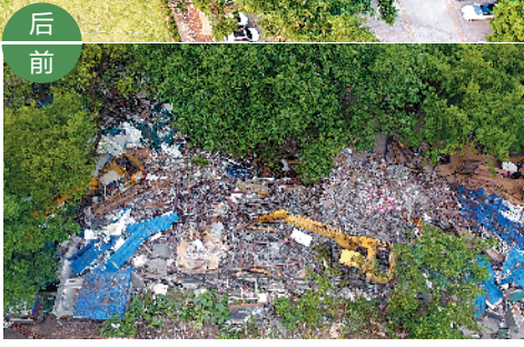
白云山南门金贵停车场拆违前