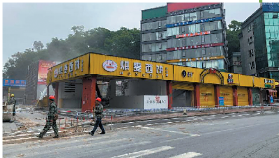
白云山南门金贵停车场拆违前