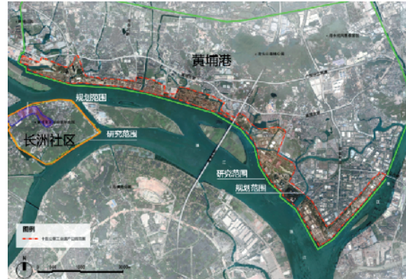
“黄埔临港15公里工业遗产公园规划”研究和规划范围

根据广州开发区城市规划信息编研中心在广州市政府采购网发出的《黄埔临港15公里工业遗产公园规划》招标公告,黄埔区、广州开发区拟聘请有资质单位,在2021年12月31日前,协助完成《黄埔临港15公里工业遗产公园规划》。招标文件透露,该区拟在目前已逐步动工中的黄埔临港经济区内,将珠江沿岸15公里范围内的工业遗产进行普查。对有价值的工业遗产进行保护,并进行公园化升级改造,打造历史和现代未来交相辉映的世界一流滨水岸线。黄埔临港15公里工业遗产公园规划研究范围包括总面积约6650公顷的黄埔临港经济区和长洲岛,其中项目规划总面积约797公顷,由西至东依次划分为鱼珠、长洲岛(黄埔船厂及宿舍)、老港、乌冲、文冲、建翔、新港、穗港八大片区。根据招标文件内容,未来的黄埔临港经济区内,不仅有升级改造后的现代化商务区,还将尊重原有地块分布众多的文化和工业建筑的特点,建设港口博物馆、船坞博物馆、海丝博物馆等博物馆群。以“工业遗产公园”的名义,守住一线江景,做到水景、文化与城市生活串联,尽量保护更多有价值的工业遗产。黄埔区、广州开发区,希望中标单位对规划范围内开展工业遗产的普查、建档和配合挂牌工作,积极开展申报国家工业遗产工作;对有条件活化利用的现有工业遗产,进行创新政策条例研究;协助黄埔区、广州开发区制定《黄埔临港15公里工业遗产公园规划方案》,从工业遗产角度对规划研究区域的控制性详细规划调整提出优化建议。