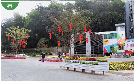
“永泰站广场”拆违建复绿前后对比