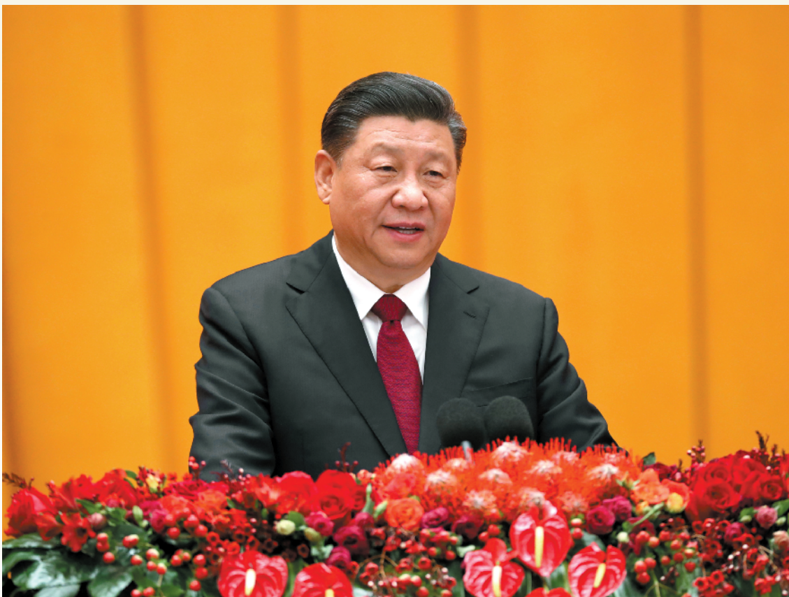
1月23日，中共中央、国务院在北京人民大会堂举行2020年春节团拜会。中共中央总书记、国家主席、中央军委主席习近平发表讲话

代表党中央、国务院，向全国各族人民，向香港特别行政区同胞、澳门特别行政区同胞、台湾同胞和海外侨胞拜年 李克强主持 栗战书汪洋王沪宁赵乐际韩正王岐山出席