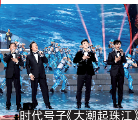
时代号子《大潮起珠江》

今年的广东春晚可谓群星荟萃,一众拥有全国影响力的实力歌手、来自粤港澳大湾区的著名艺人以及新生代生力军齐聚登台拜大年,给观众送上新春祝福。 “中国三大男高音”戴玉强、魏松、莫华伦携手洪之光、南枫、黄子弘凡、方书剑、高宝利、刘望等青年歌手,共同演绎时代号子《大潮起珠江》。前辈与后辈组成“沉稳+活力”