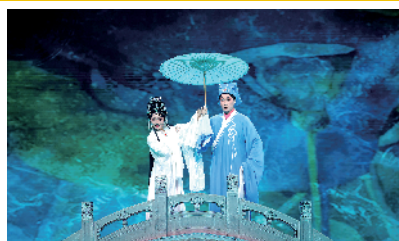
曾小敏、文汝清《白蛇传·千年之恋》

“粤味”晚会里自然少不了粤语。2019 年广东卫视首度办春晚,便在节目中加入了粤语节目,并收获了众多好评。今年,王伟华和主创团队更加重视了粤语在晚会中的比例:一方面,在主持人的串词中粤语佳句频出;另一方面,粤语金曲接连登场,国内首部 4K 超高清粤剧电影《白蛇传·情》片段也在晚会中亮相,粤剧名家、梅花奖得主曾小敏将搭档文汝清、张艺凡、邹经豪演绎《白蛇传·千年之恋》。