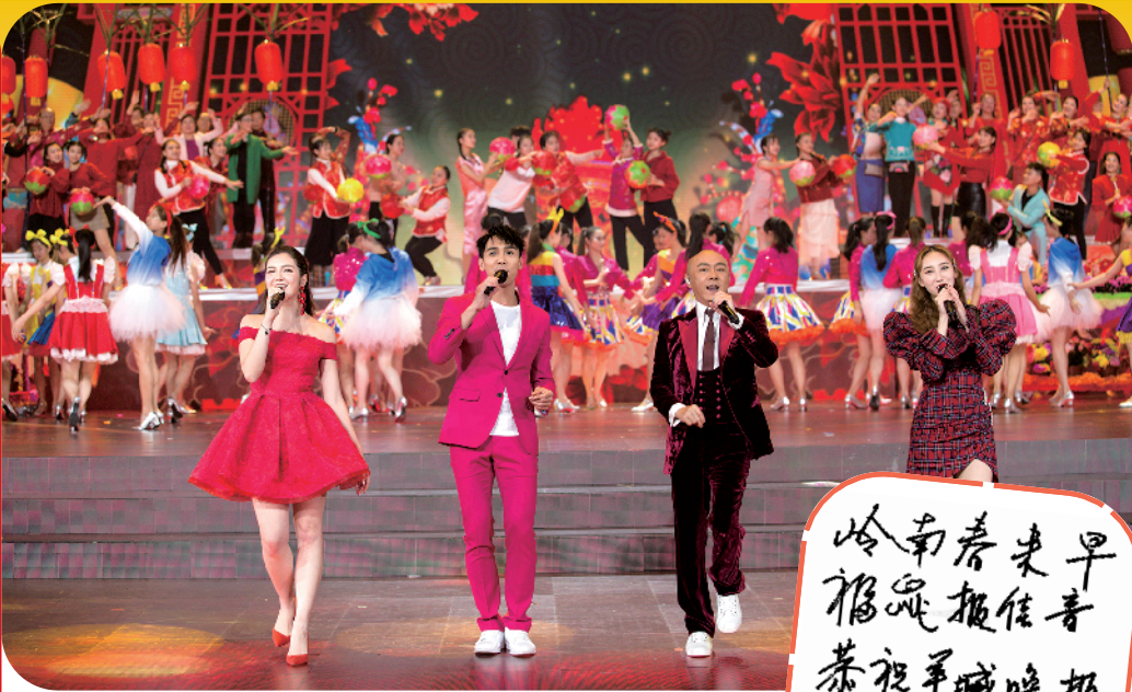
张卫健、许靖韵《春风十里送吉祥》

今晚 7:35, “岭南春来早”——2020 广东卫视春节晚会(以下简称“广东春晚”)将为观众呈现一台“粤味”浓郁的文艺盛宴。晚会总导演王伟华对羊城晚报记者表示,“年味、粤味、时代感”是 2020 广东春晚的三个特点:“我们要做出自己的韵味,打造岭南特色的粤式春晚。”