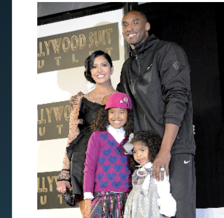
2011年2月19日，科比和妻子女儿合影

科比出生于1978年8月23日，在1996年NBA选秀大会以第13顺位被夏洛特黄蜂选中。洛杉矶湖人总裁韦斯特极为看好科比的天赋，用主力中锋迪瓦茨换来这位传奇高中生。湖人随后构建梦幻搭档，“OK组合”奥尼尔和科比所向披靡，“禅师”杰克逊指挥若定，紫金军团在2000到2002年实现三连冠。