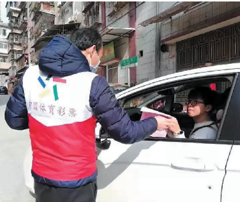
广东体彩人来到公共场所进行宣传引导

正可谓病毒无情人有情。危难面前,很多人都在默默地守护着我们的家园。他们希望通过自己的一点努力,带动更多的人散发微光,并将这微光凝聚,照亮前方。