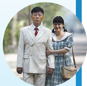
《父母爱情》依然受欢迎

《父母爱情》一再重播,依然受到观众欢迎:“非常时期在家陪爸妈看《父母爱情》,依然爱看。”“爸妈看《父母爱情》看得无比投入,时不时爆发出阵阵大笑。真是好剧,为家庭和谐做出巨大贡献。”