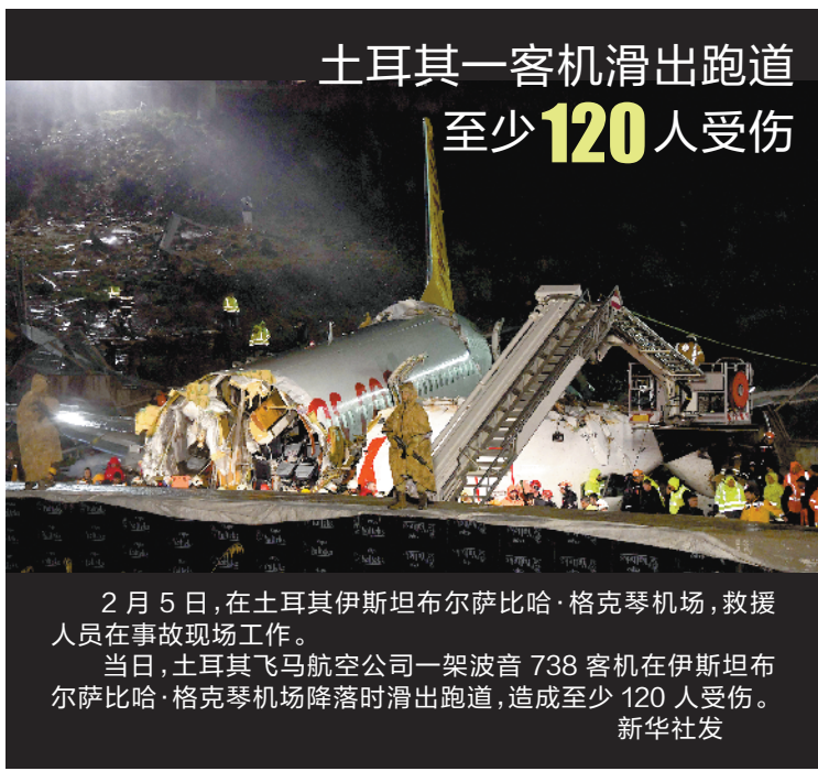
土耳其一客机滑出跑道 至少120人受伤

当然,佩洛西郁闷之下,也许考虑不到这么多。而她的郁闷,其实也反映了民主党的困境。